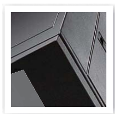
Cabinet made from 'cold rolled plate'